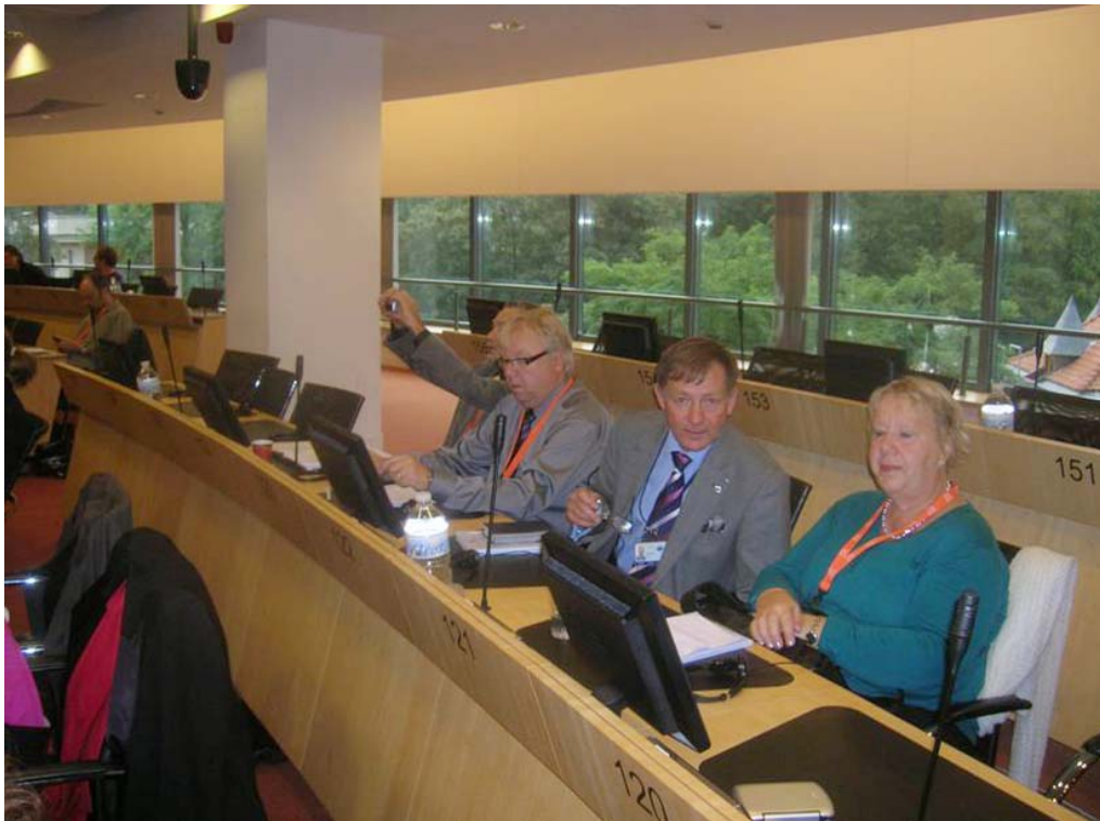
Kronobergsdelegationen vid Open Days, foto Ragnar Lindberg

Kronoberg deltog vid åtta seminarier som alla var inom området hälso- och sjukvård. Det innebar att vi tog del av 25-30 föreläsningar. Aktuella teman var i år, liksom de senaste åren: E-hälsa med elektroniska journaler – informationsöverföringar – telemedicin o s v, den farmakologiska utvecklingen med genterapi och individanpassad medicinering och molekylärbiologi, tidigdiagnostik och screening, preventiv hälso- och sjukvård, ”crossborder healthcare”, organisationsutveckling med fokus på tillgänglighet och kvalitet samt demografi och äldresjukvårdsfrågor. Årets program var också i hög grad präglad av den globala finansiella krisen.