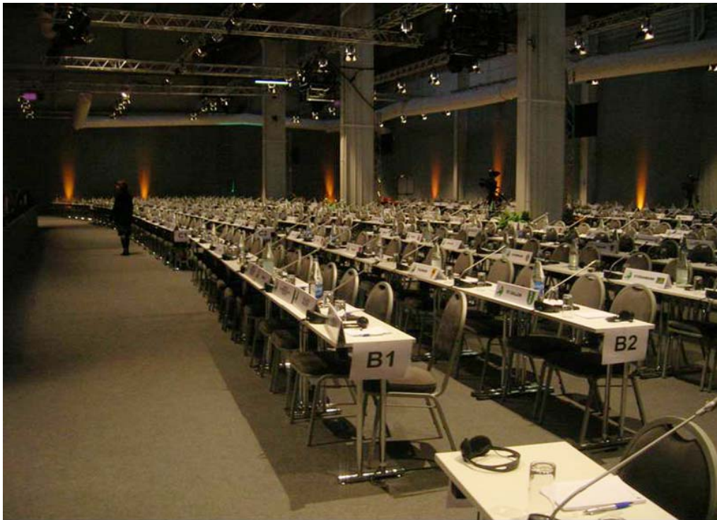
Generalförsamlingens plenisal i Belfort

Cirka 450 delegater från 130 regioner deltog. Dessutom deltog en stor mängd ”gäster”, mediarepresentanter och andra.