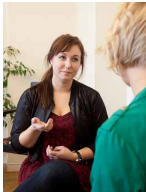
En av frågorna att diskutera är hur föräldrar ska bemötas.