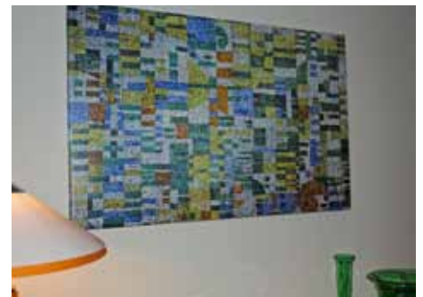
En önskan personalen hade var att behålla en mosaikvägg som fanns i den gamla vårdcentralen. Det var tyvärr omöjligt, men istället fick det ett foto av mosaiken att ha i personalrummet, en gåva ifrån fastigheter.