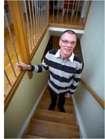
Små steg framåt 20