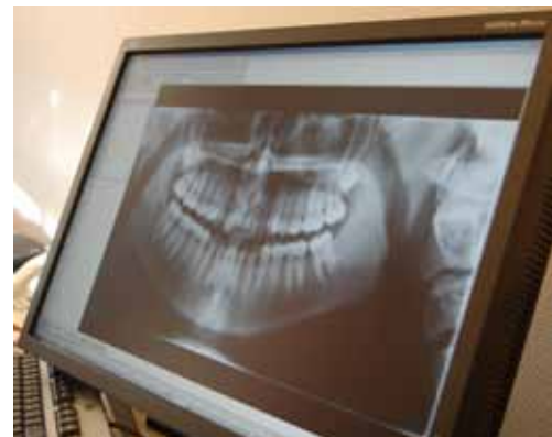
...och en tydlig bild syns snabbt på skärmen.