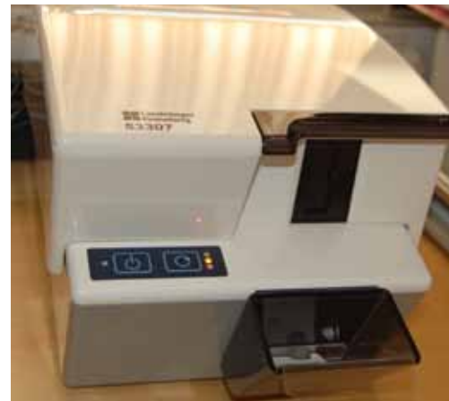
...gör att man slipper framkalla i mörkrum...