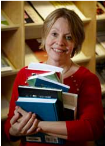
Ny på bibblan 16