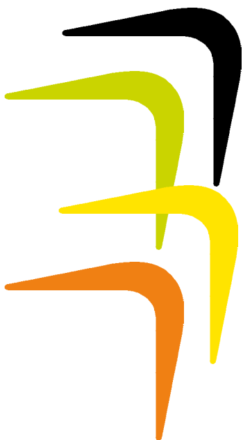
De nya färgerna och den nya kroken som används i till exempel annonser och bildspel.