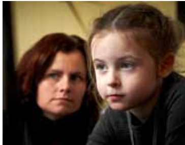
Bra och roligt för stora och små på 1177.se